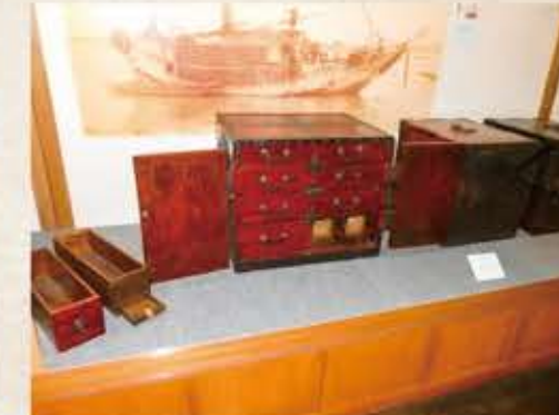
船箆箱 Ship chest (小樽市総合博物館所蔵)