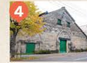
4 旧右近倉庫 The Former Ukon Warehouse