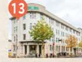
13 旧北海道拓殖銀行小樽支店 The Former Otaru Branch of Hokkaido Takushoku Bank