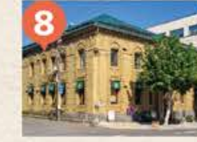
8 旧北海道銀行本店 The Former Main Branch of the Bank of Hokkaido