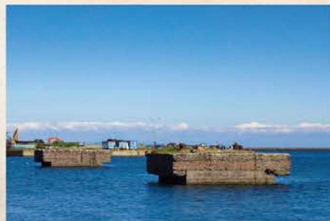
北炭ローダー基礎 Hokutan loader foundation