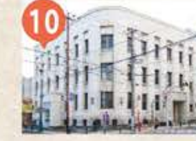
10 旧第一銀行小樽支店 The Former Otaru Branch of Dai Ichi Bank