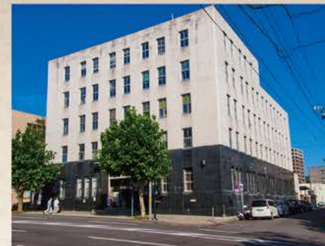
色内銀行街（旧三井物産小樽支店） Ironai Bank Street (former Mitsui & Co., Ltd. Otaru Branch)