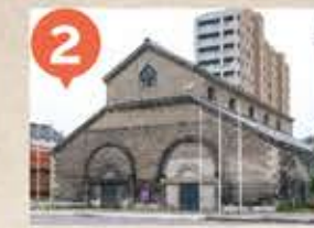
2 旧大家倉庫 The Former Ohie Warehouse