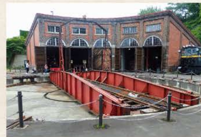
旧手宮鉄道施設（国指定重要文化財） Former Temiya Railway Facility (National Important Cultural Property)