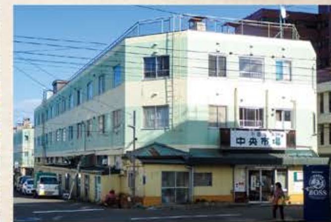
小樽中央市場 Otaru Central Market