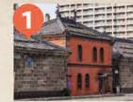
1 旧小樽倉庫 The Former Otaru Warehouse