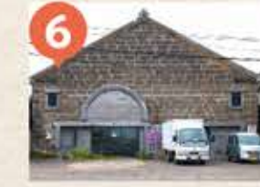
6 旧増田倉庫 The Former Masuda Warehouse