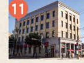
11 旧三菱銀行小樽支店 The Former Otaru Branch of Mitsubishi Bank