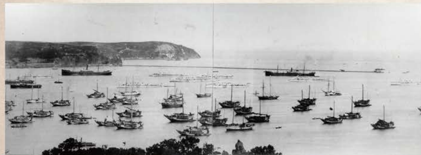
明治 36（1903）年 8 月小樽港

北前船の船乗りたちは、2 月末から 3 月頃、残雪のふるさとを後に大阪に向かって出発します。到着すると船乗りたちは帆を縫う者、預けていた船を修理する者、積荷を買い出す者など、手分けをして出港の準備を進めます。日常生活雑貨・古着・酒・航海中の食糧などを積み込み、大阪を出港するのは 3 月末から 4 月はじめです。瀬戸内の各港に立ち寄り、特産の塩・紙・蠟・畳表・御影石などを積み下関を通して日本海側に出て北上します。途中、日本海沿岸の各港でも米やその地の特産物や薬製品（縄・蕨・筵）、鉄・材木などを積み込みます。積んでいる商品で、高い値がつくものがあれば途中の港で降ろし、その地で売ることもありました。