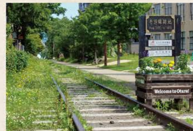
手宮線跡及び附属施設 Temiya Line trace and affiliated facilities