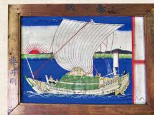
船絵馬 Funa-ema