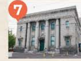
7 旧安田銀行小樽支店 The Former Otaru Branch of Yasuda Bank