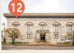
12 旧三井銀行小樽支店 The Former Otaru Branch of Mitsui Bank