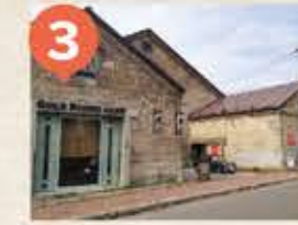
3 旧澁澤倉庫 The Former Shibusawa Warehouse