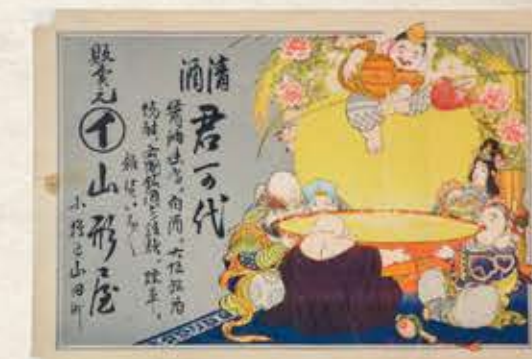
引札 Hikifuda