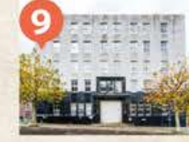
9 旧三井物産小樽支店 The Former Otaru Branch of Mitsui Trading Company