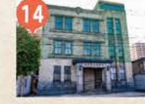
14 旧小樽商工会議所 Otaru Chamber of Commerce