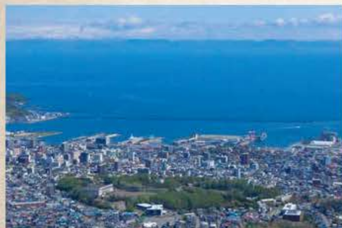
小樽港北防波堤 Otaru port north breakwater