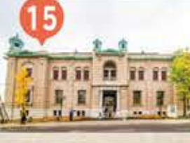
15 日本銀行旧小樽支店金融資料館 The Bank of Japan Otaru Museum