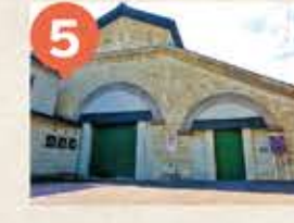
5 旧広海倉庫 The Former Hiroumi Warehouse